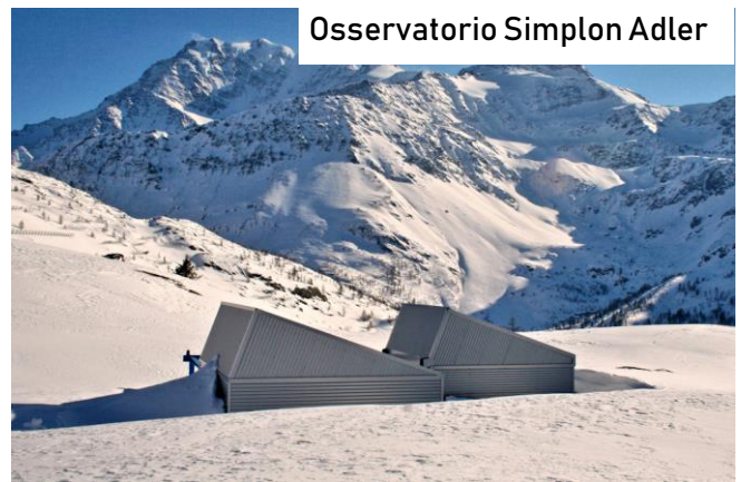
Osservatorio Simplon Adler

Scopriremo anche un osservatorio di montagna sul Sempione, un’ampia struttura che intendiamo proporre come visita per il prossimo autunno.